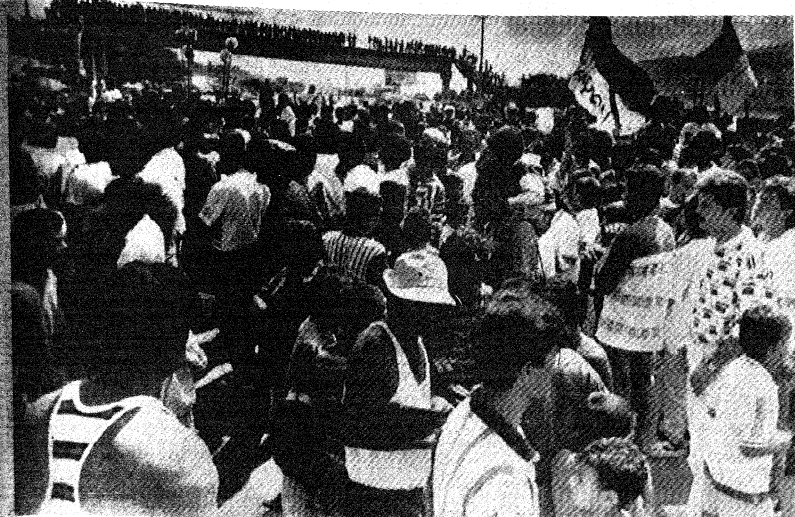
El público se agolpa frente a las instalaciones de la morgue de Medellín, donde fue llevado el cuerpo de Andrés Escobar. Hay dos detenidos por el asesinato, pero el autor material del crimen, ya identificado, aún no fue localizado por la policía.