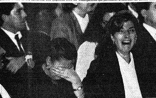
Familiares y amigos de Andrés Escobar no ocultan su pesar por la injusta muerte del destacado futbolista internacional cuya joven vida fue interrumpida por la insania.