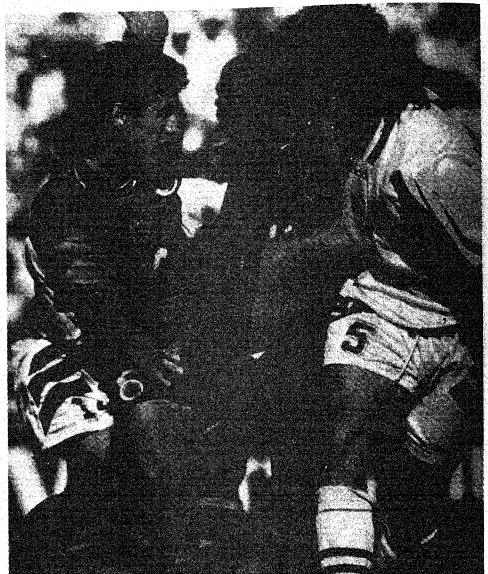
Andrés Escobar en acción en el partido contra Rumania. El zaguero pudo haberse encontrado de vacaciones en Estados Unidos, pero prefirió regresar a su patria, donde encontró inexplicable muerte

"Colombia es un equipo cuando el está y otro en su ausencia".